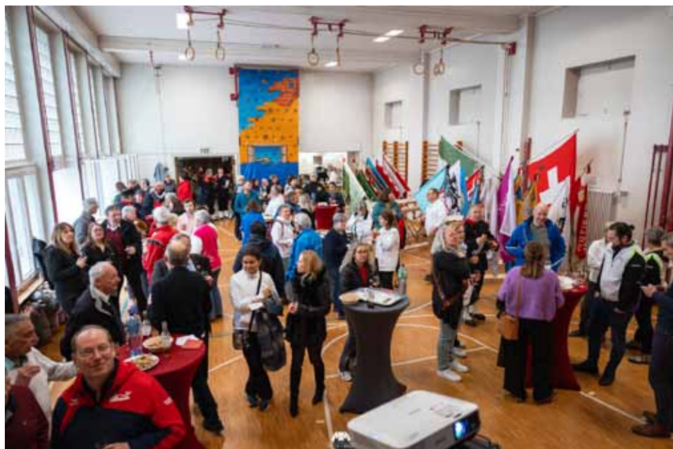
Les représentants des sociétés ravis de se retrouver pour la verrée du gymnaste.