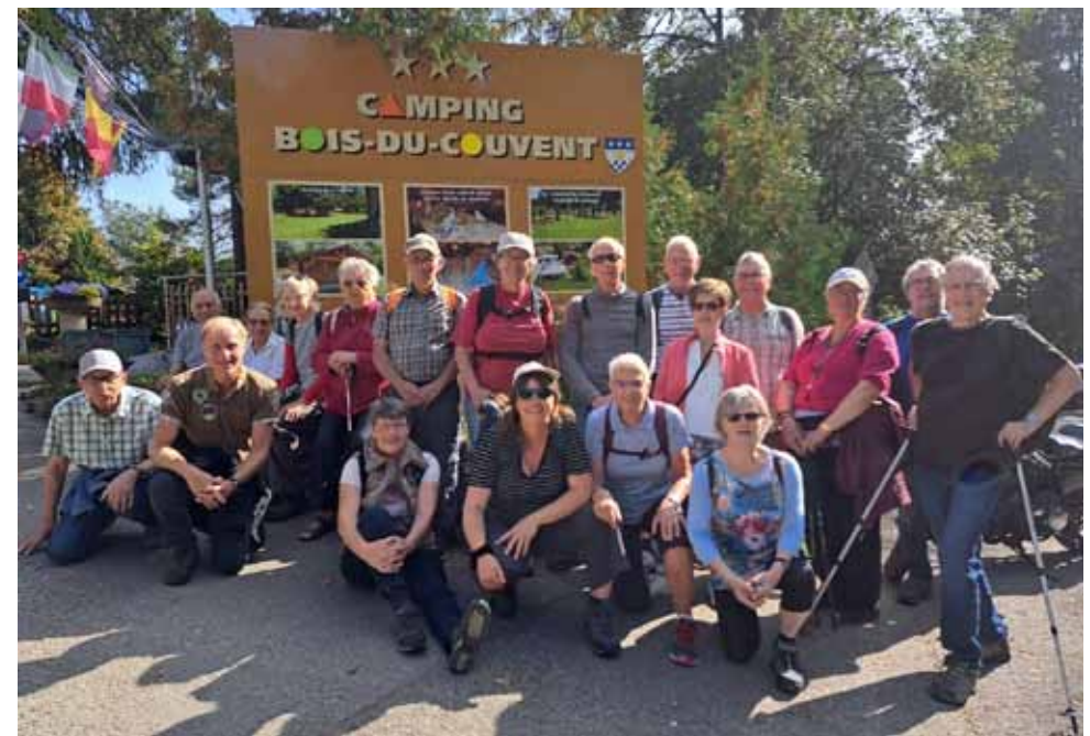
La nouvelle équipe de la FSG Abeille mixte.

Et voici notre nouvelle équipe de la FSG Abeille Mixte :