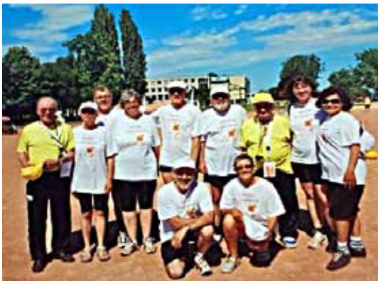
Membres de la Gym Mixte.

En septembre 2006, il ne restera plus que 5 membres et ce sera le début de la