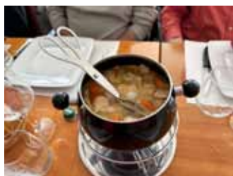
De bonnes tripes ont été dégustées.

S'ensuit le traditionnel repas « tripes » pour la majorité d'entre nous et oufff ! un