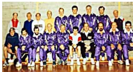
Membres de la Gym Hommes de la Chaux-de-Fonds.

En septembre 2006, il ne restera plus que 5 membres et ce sera le début de la