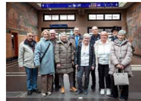
Une partie des ancien-nes président-es et nos deux présidentes actuelles prennent la pose en attendant le départ du train.