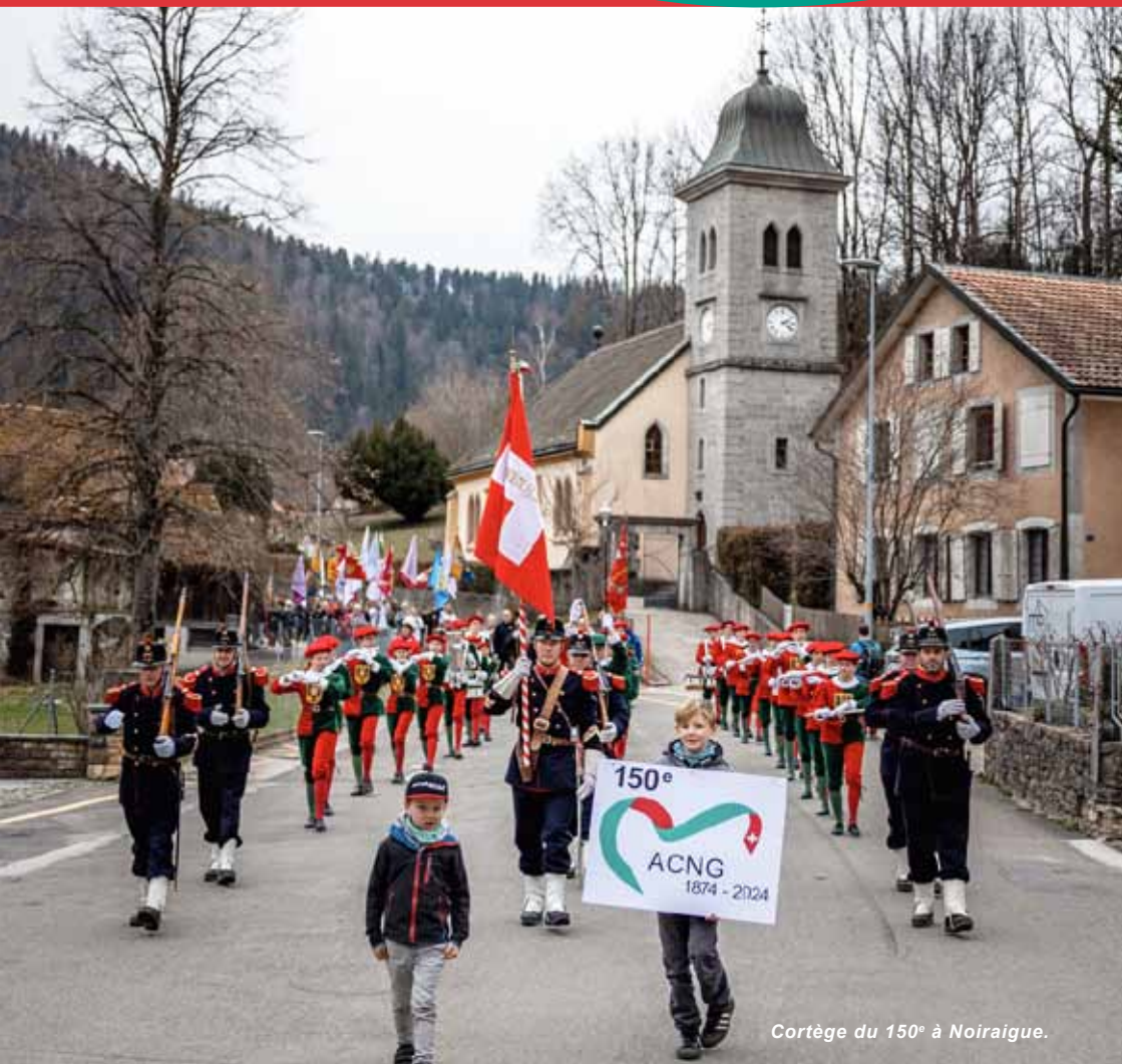
Cortège du 150 e à Noirigue.