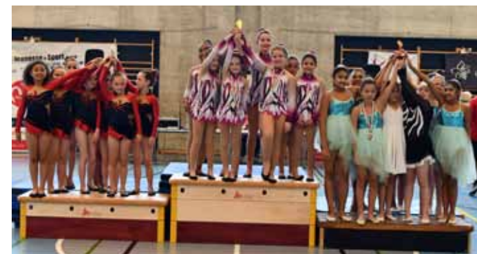
Podium - 12ans 1 ère Fémina Hauterive 2 ° Couvet 3 ° NE-GYM.