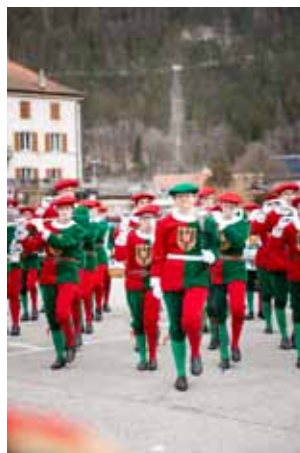
Le ShowBand des Armourins a accompagné le cortège des bannières à travers le village de Noiraigue.