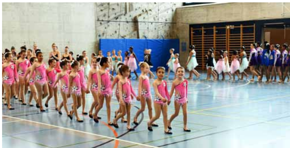
Entrée des gymnastes à la cérémonie protocolaire.

L'équipe de Fémina Hauterive et la commission gym et danse de l'ACNG ont su mener cette journée de double concours avec brio pour terminer avec une légère avance ce qui a permis de proclamer les podiums tant attendus par nos gymnastes sans tarder. Les résultats sont disponibles sur le site de notre association cantonale, www.acng.ch .