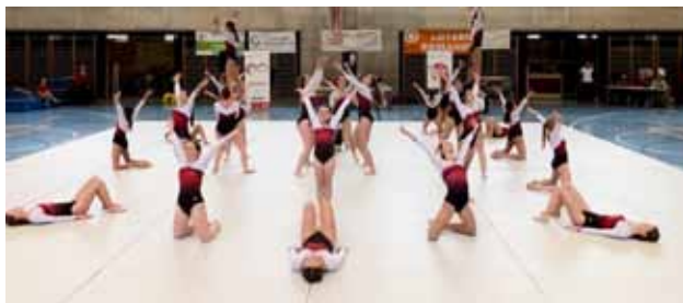
Gym Chézard au sol.