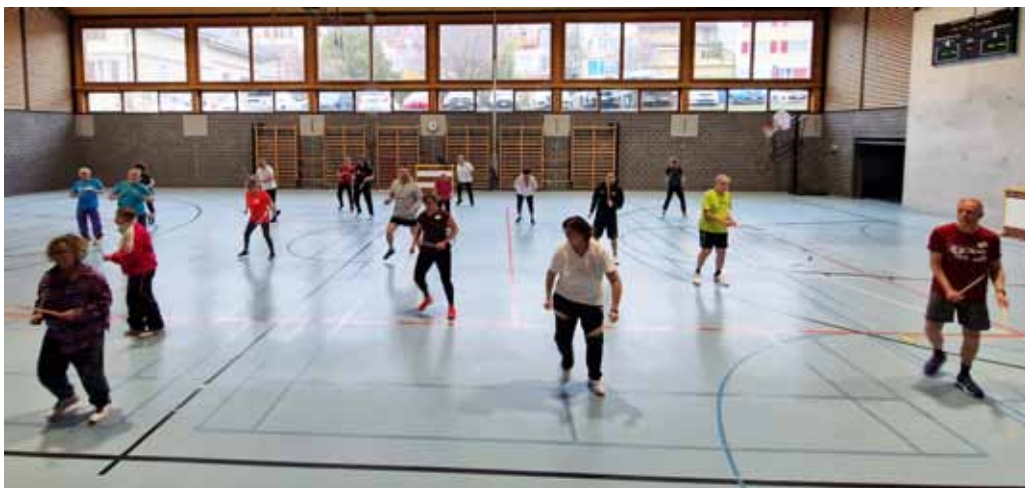
Nos moniteurs en forme durant la leçon de Drumsticks.