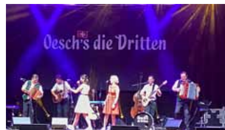
Oesch's die Dritten ont mis une folle ambiance dans la salle.

Une fois les tables délestées des caquelons et des réchauds, l'excitation était à son comble. Sur le coup de 21h30, l'extinction de l'éclairage annonça l'arrivée sur scène des « Oesch's die Dritten ». Il aura fallu moins de deux