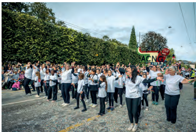
Les participants en pleine action.

La matinée a débuté par un entraînement de la Flash Mob en formation très compacte afin de donner une impression