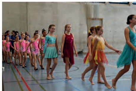
Entrée des gymnastes.

Dimanche 1 er septembre, une nuée de gymnastes se retrouve à Cernier pour ce désormais traditionnel concours. Pas moins de 300 gymnastes des cantons romands se sont inscrites dans les différentes catégories. Tout démarre à 7h30 avec 3 collèges de juges et se termine à 17h45 par la remise des prix et les podiums tant attendus.