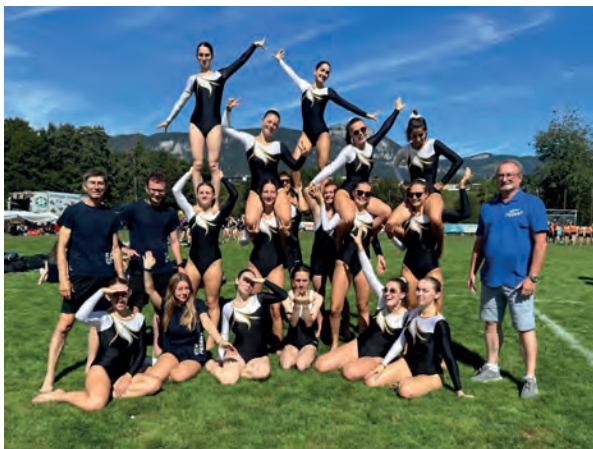
Magnifique présentation de la Gym-Peseux.