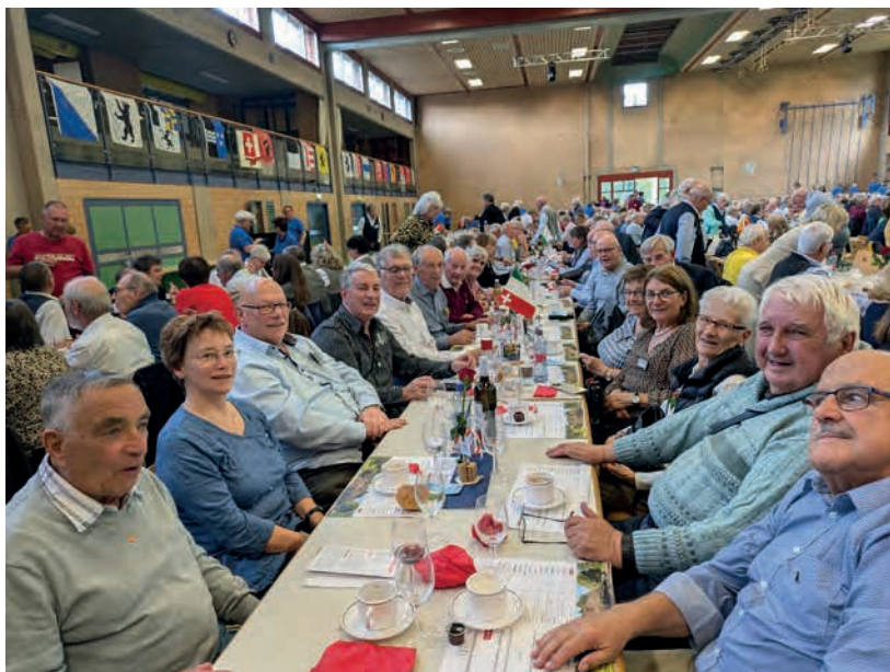
A table !