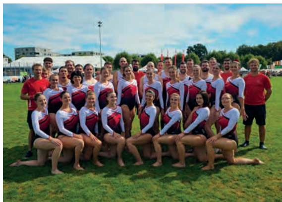
La Gym-Chézard-St-Martin fière de sa performance.

Idealement placé, après la pause estivale et une semaine avant les championnats suisses de Sociétés (CSS, 6-7 septembre à Zuchwil), ce concours a permis aux trois groupes de procéder aux derniers réglages et mises au point, précédant ainsi le dernier grand rendez-vous de la saison 2024 !