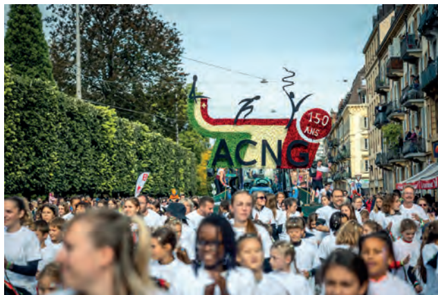
L'ACNG fleurie pour les 150 prochaines années.