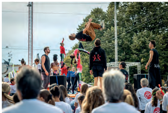
Que d'acrobaties sur ce char !