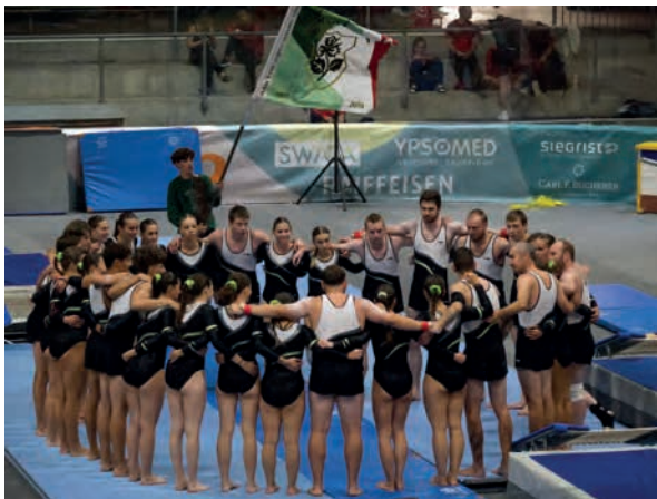
Motivation et concentration avant l'épreuve pour Gym-La Coudre.