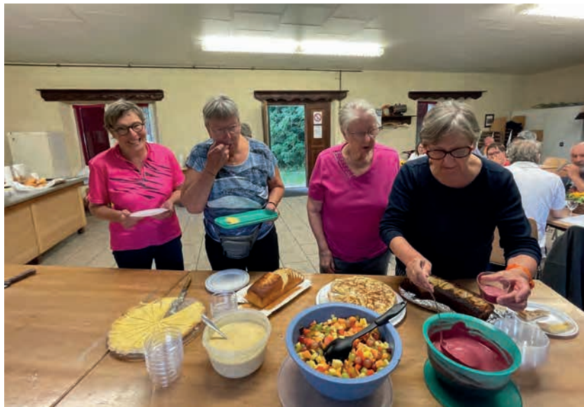
Gourmandes les dames honoraires.