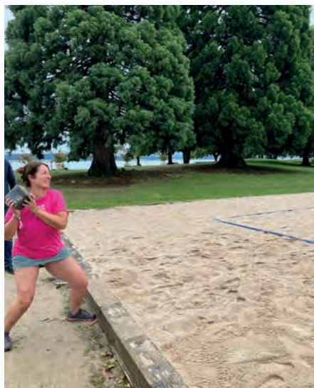
Il fait froid, la pierre est lourde... mais une vraie gymnaste garde toujours le sourire !

Notre dimanche matin du 25 août a donc été sportif malgré la météo peu attrayante contrairement à celle qu'ils ont eu le jour précédent. Grisaille et froid étaient au rendez-vous, mais ce n'est pas moins de 80 personnes qui ont réchauffé l'atmosphère en s'essayant au lancer de la pierre. Un pari un peu fou pour la plupart lorsque nous annonçons le poids de cette dernière. En effet, la pierre pour les femmes pèse 6kg et 12,5kg pour les hommes.