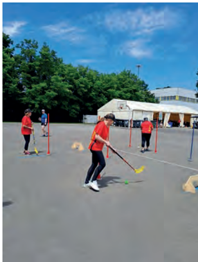
La FSG Le Locle en pleine action.