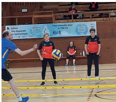
La FSG Le Locle à l'épreuve du ballon.

Les responsables ACNG de ces disciplines sont au service de votre