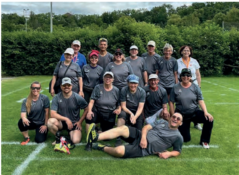
Le Groupe ACNG en pause.