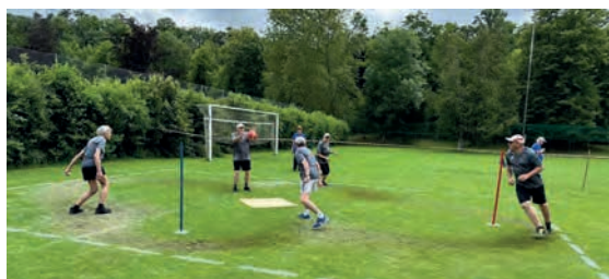
Le Groupe ACNG se donne à fond dans ce concours.

Des équipes bien décidées à défendre le F majuscule du mot Fête avec respect, plaisir et le souhait d'aucune blessure.